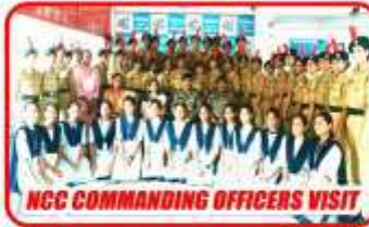
NCC COMMANDING OFFICERS VISIT