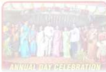
ANNUAL DAY CELEBRATION