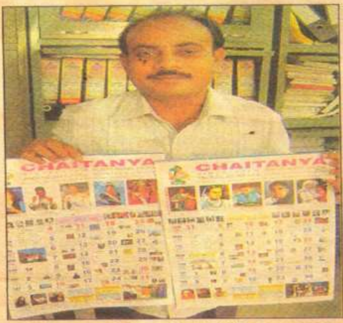
రూపొందించిన క్యాలెండర్తో చిన్నారావు