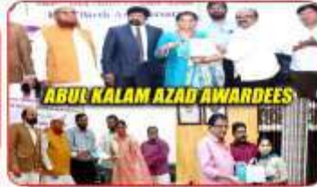
ABUL KALAM AZAD AWARDEES