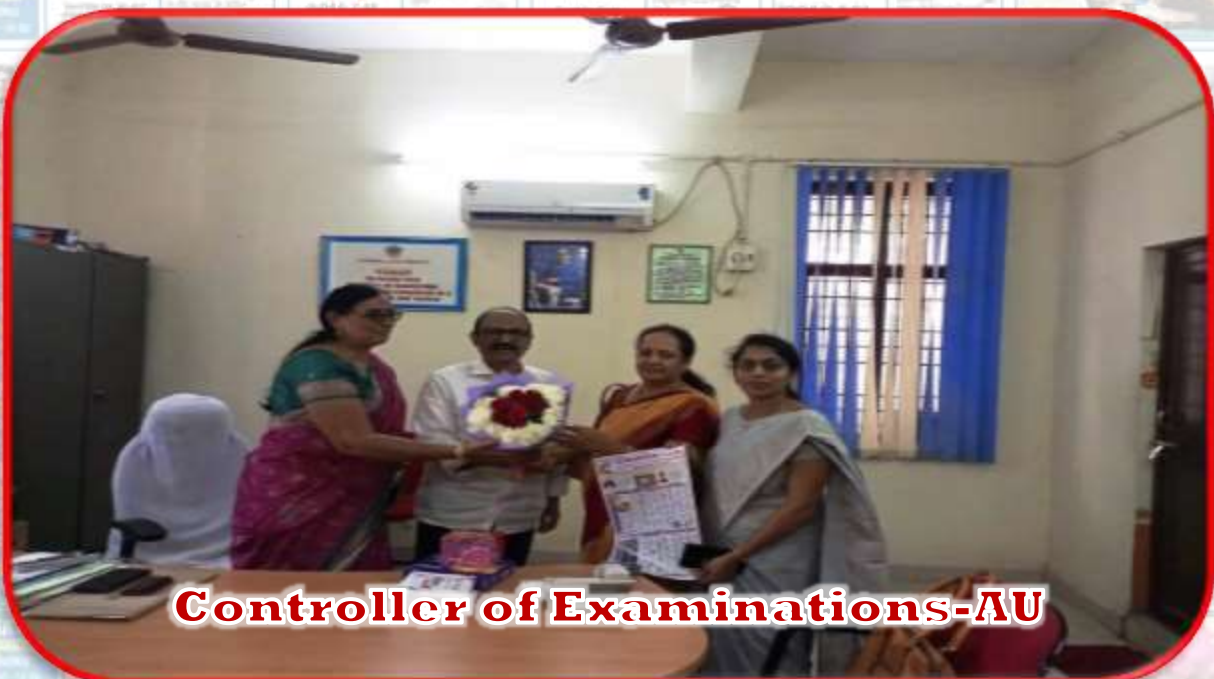
Controller of Examinations-AU

"The future depends on what we do in the present." Mahatma Gandhi