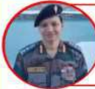
Colonel Geeta Rana

The first Women warriors in Defence Forces