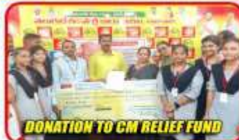
DONATION TO CM RELIEF FUND