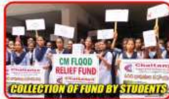
COLLECTION OF FUND BY STUDENTS