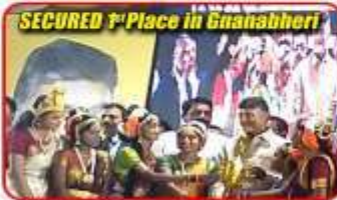
SECURED 1 st Place in Gnanabheri

First Woman officer from Rajasthan , acquired Bachelor's Degree in Civil Engineering , father died when she was 11 years old , mother is a house wife, she is the first woman to get deployed in Siachen Glacier in 2023 with her undimmed commitment, which is a historic stride towards gender equality in Indian Military .