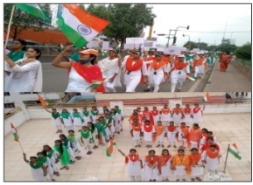
Azadi Ka Amrit Mahotsav