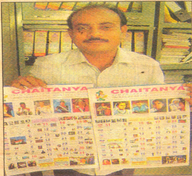
రూపొందించిన క్యాలెండర్తో చిన్నారావు