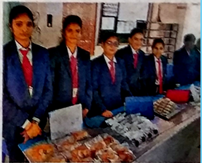
ప్రదర్శనలో పాల్గొన్న విద్యార్థినులు