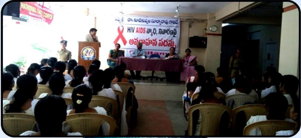
శ్రీమద్రాజ్ కళాశాల, విజయవాడ - 515002