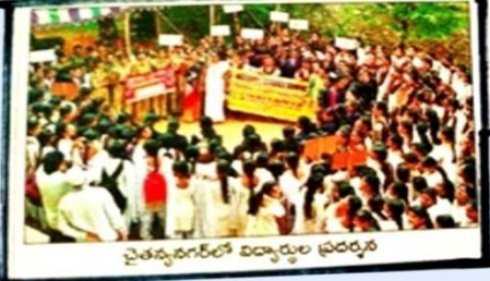
వైతన్యశాలలో విద్యార్థుల ప్రదర్శన

పాఠశాలలో వైద్యశాలలోని వైద్య మహిళా కిక్కిరించిన కార్యక్రమం. అందరి కార్యక్రమం విజయ వాడలో, రోడ్డు పక్కన ఉన్న వైద్యశాలలో. పాఠశాలలో ర్యాలీలు. మానవతానికే నిరంకుశం. మన ప్రతి అభ్యుదయం, నిజాయితీ పాలన.